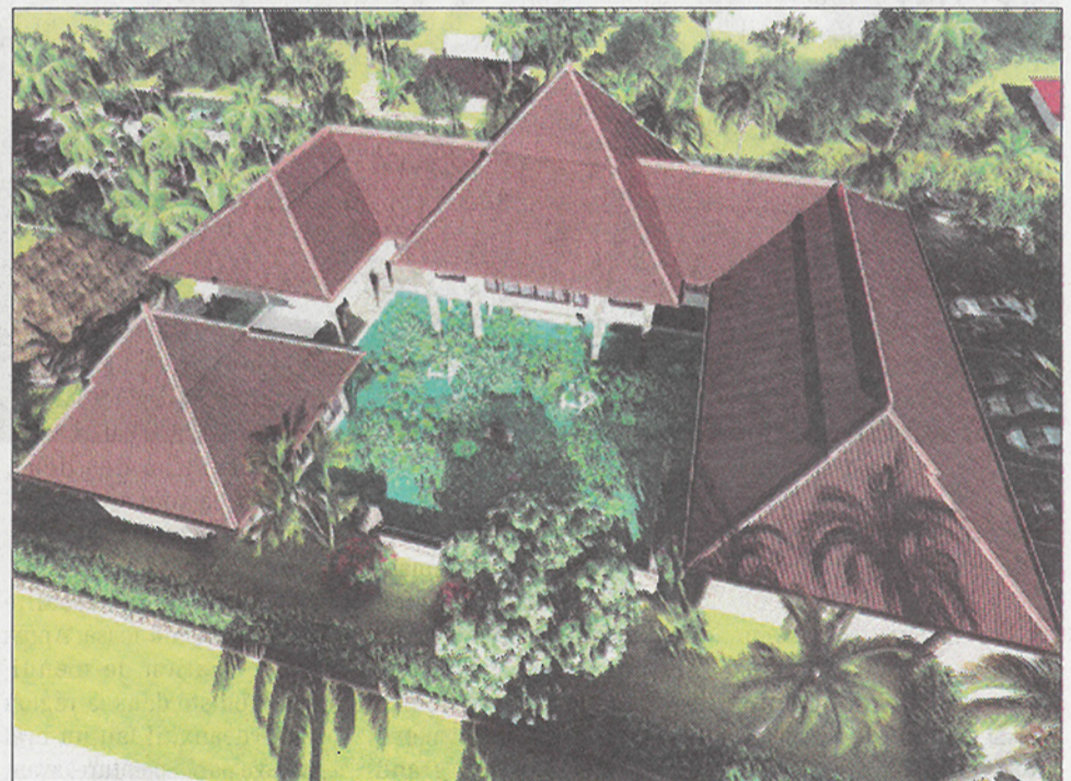
Le bâtiment sera conçu en U et rassemblera tous les services de la commune et la brigade municipale.