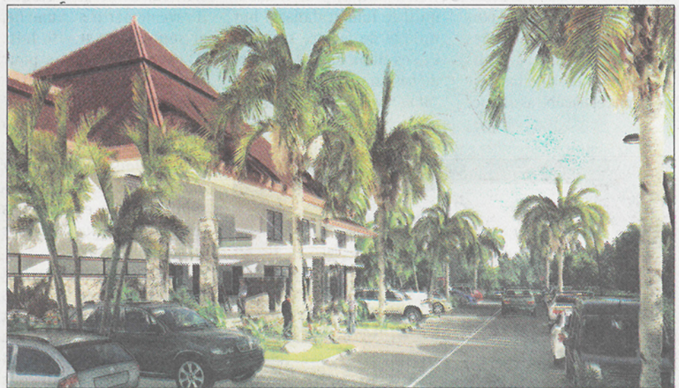
Vue extérieure avec des parkings pour le stationnement des véhicules.