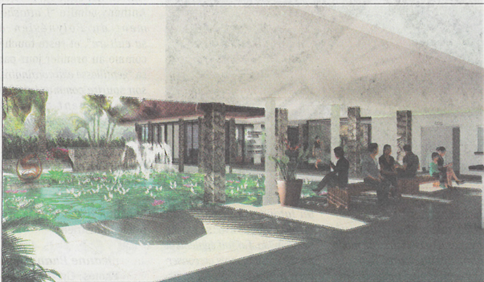
Un bassin d'eau viendra égayer le cadre.